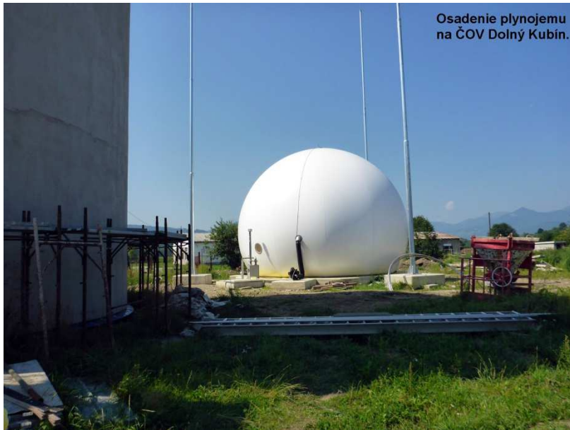
Osadenie plynojemu na ČOV Dolný Kubín.