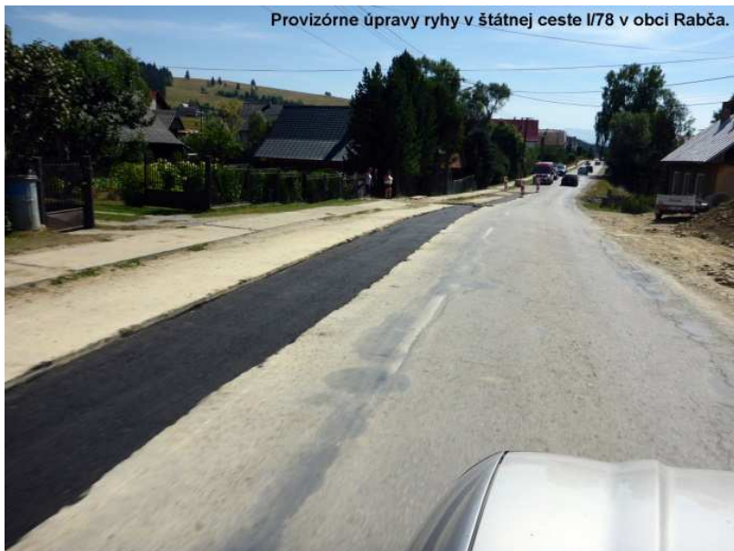
Provizórne úpravy ryhy v štátnej ceste I/78 v obci Rabča.