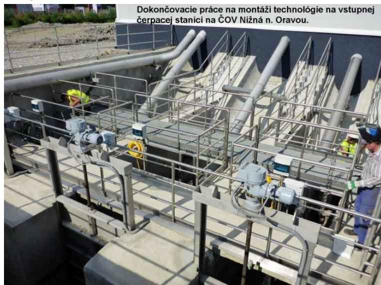
Dokončovacie práce na montáži technológie na vstupnej čerpacej stanici na ČOV Nižná n. Oravou.

Prebieha odstraňovanie vád a nedorobkov. PS 4 Plynové hospodárstvo – rekonštrukcia, montáž prepojovacích potrubí plynového hospodárstva, montáž strojno technologických zariadení v kompresorovni. ČOV pracuje v režime skúšobnej prevádzky. Celý objekt čistiarne odpadových vôd je v záverečných štádiách výstavby kde sú hlavné funkčné celky v prevádzke a prebieha hlavne odstraňovanie vád a nedorobkov a realizácia súvisiacich pridružených prác.