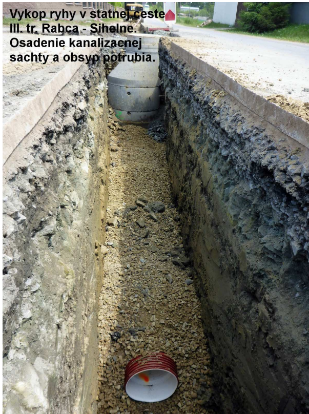
Vykop ryhy v statnej ceste III. tr. Rabca - Sihelne. Osadenie kanalizačnej sachty a obsyp potrubia.