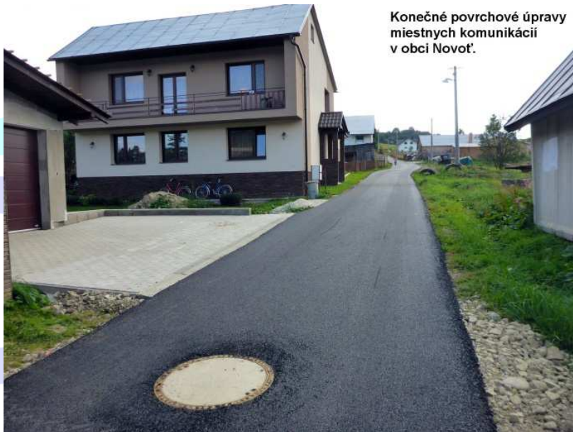
Konečné povrchové úpravy miestnych komunikácií v obci Novot'.