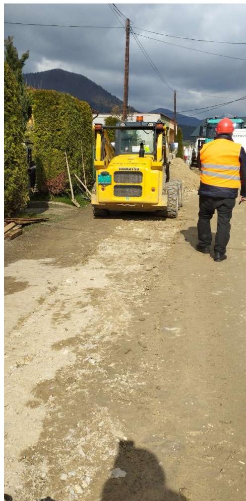
Obr. 1: Budovanie kanalizácie - stavebné práce v miestnej komunikácii v obci Žaškov (SS.01)