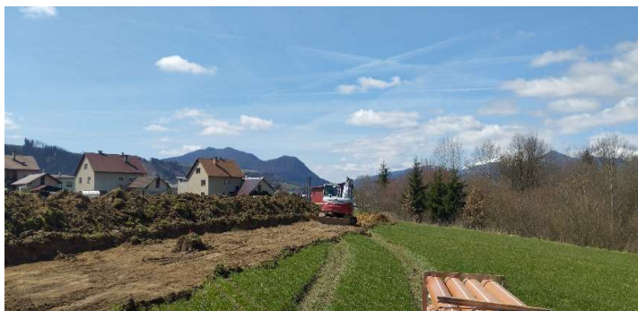
Obr. 5: Sťahovanie ornice a výkopové práce pre uloženie výtlačného potrubia „V1“ - PE-HD DN200 (SS.07)