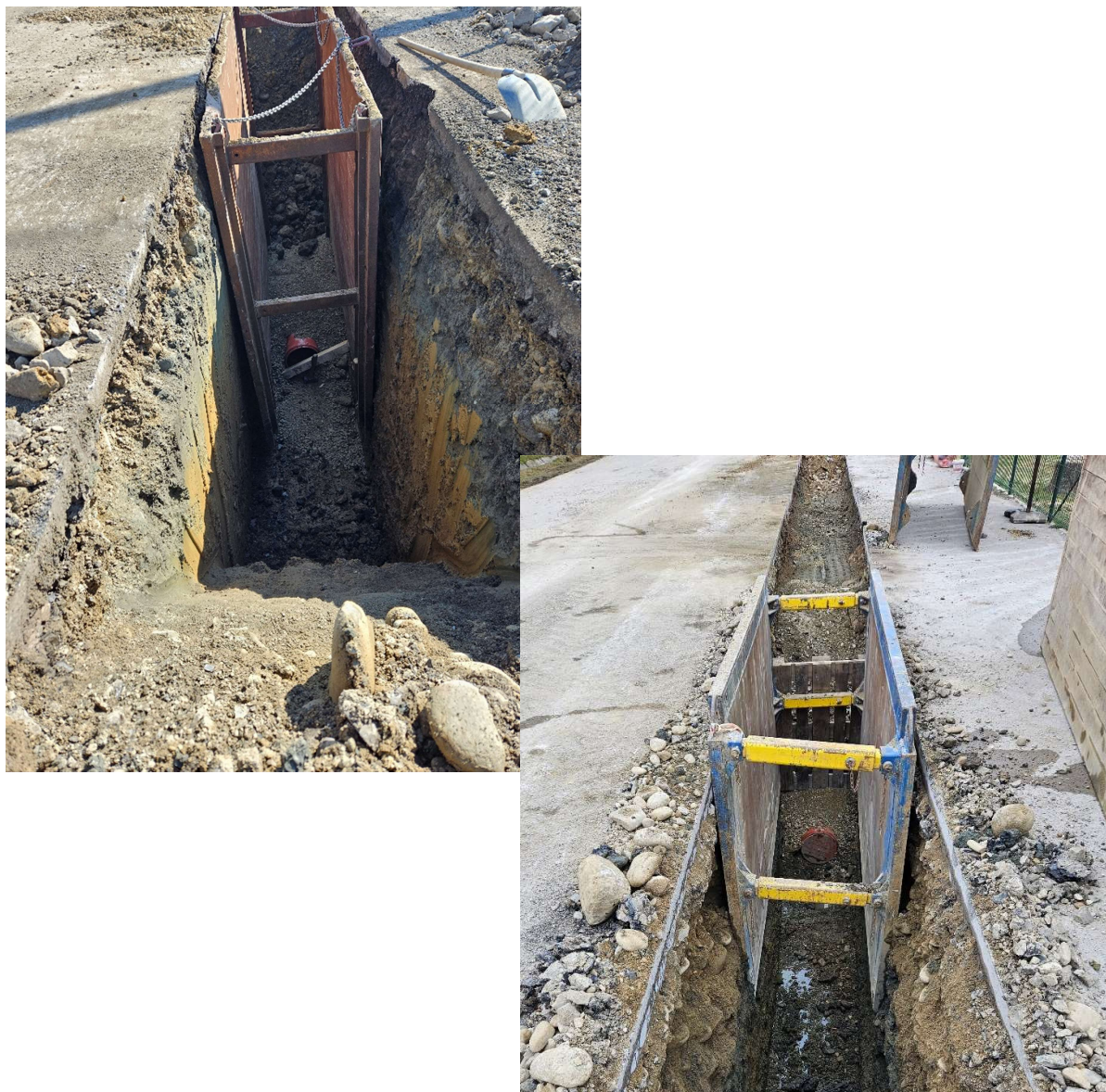
Obr. 3 Budovanie verejnej kanalizácie v obci Párnica (SS.02)

Na začiatku sledovaného obdobia bolo v dôsledku nepriaznivého počasia potrebné vo zvýšenej miere udržiavať najmä miestne komunikácie.