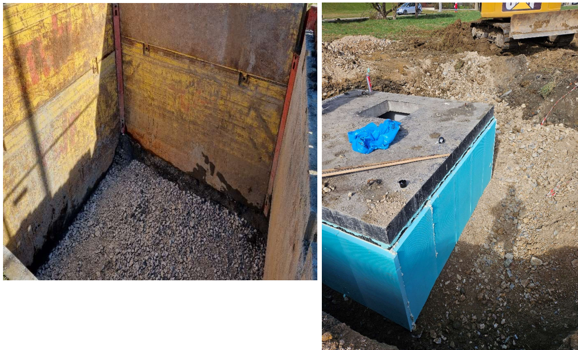
Obr.4: Osádzanie čerpacej stanice - ČS.08 v obci Párnica (SS.02)

V závere sledovaného obdobia je položených 5 511,16m kanalizačného potrubia z celkových 7 757,5 m (uvažované bez kanalizačných prípojok), čo predstavuje 71,04% kanalizačného potrubia v obci Párnica.