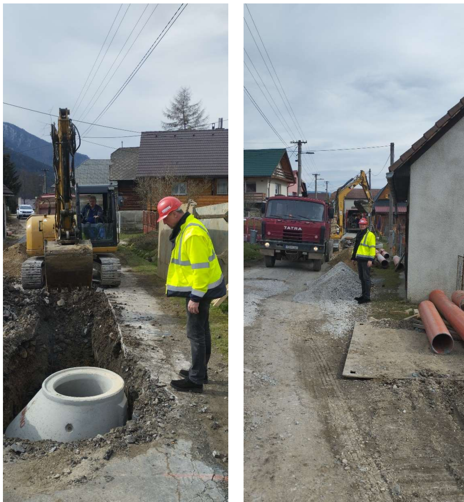
Obr. 6: Obhliadka staveniska pracovníkom OVS, a.s. v rámci zabezpečenia BOZP (SS.01 a SS.02)

V súčasnosti je položených 22,21 km z celkových 30,003 km . V závere sledovaného obdobia je vybudovaných 74,35% dĺžky kanalizačného potrubia na diele „Odkanalizovanie obcí dolnej Oravy – Žaškov, Párnica, Oravská Poruba, Veličná“.