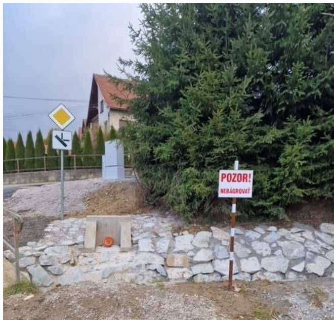
Obr. 4: ČS06 v obci Žaškov (SS.01)

K dátumu 31.10.2023 je položených 12 276,65 m kanalizačného potrubia (gravitácia a výtlač) z celkových 10 746 m (uvažované bez kanalizačných prípojok), čo predstavuje 114,24% kanalizačného potrubia v obci Žaškov. Z toho je 1 446,18 m kanalizačného potrubia, ktoré bolo naprojektované dodatočne pre novovzniknuté lokality. Prevedené boli konečné úpravy miestnych a regionálnych komunikácií.