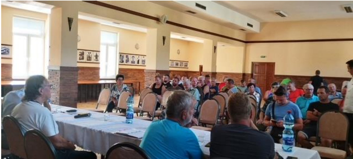
Obr. 10: Verejný hovor v obci Žaškov