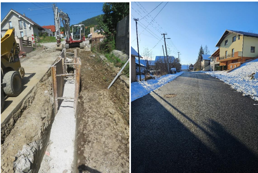
Obr. 5 Budovanie verejnej kanalizácie a konečné úpravy komunikácií v obci Párnica (SS.02)

V sledovanom období bolo položených 820,47 m kanalizačného potrubia. Pracovalo sa vetvách: A, C, B2, B2-1, V1. Vybudovaných bolo 51 ks kanalizačných prípojok k rodinným domom, čo predstavuje 186,57m.