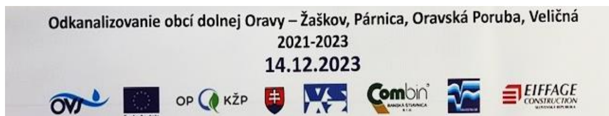
Obr. 12: Pamätná stuha Stavby

Dňa 15.12.2023 bolo zvolané konanie vo veci vydania povolenia na dočasné užívanie stavby na skúšobnú prevádzku. Ústne pojednávanie bolo spojené s miestnym zisťovaním v teréne a výslednom bolo vydané Rozhodnutie č. OU-DK-OSZP-2023/008797/7SV zo dňa 19.12.2023, právoplatné dňa 17.01.2024.