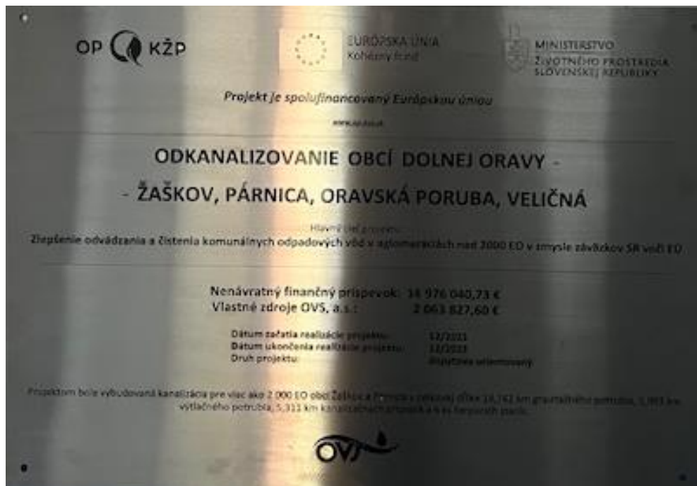
Obr. 14: Pamätná tabuľa Stavby