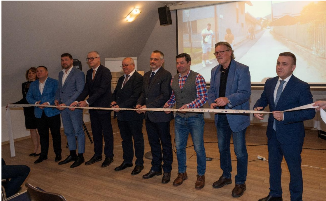
Obr. 13: Strihanie pamätnej stuhy v rámci ceremoniálu slávnostného ukončenia Stavby