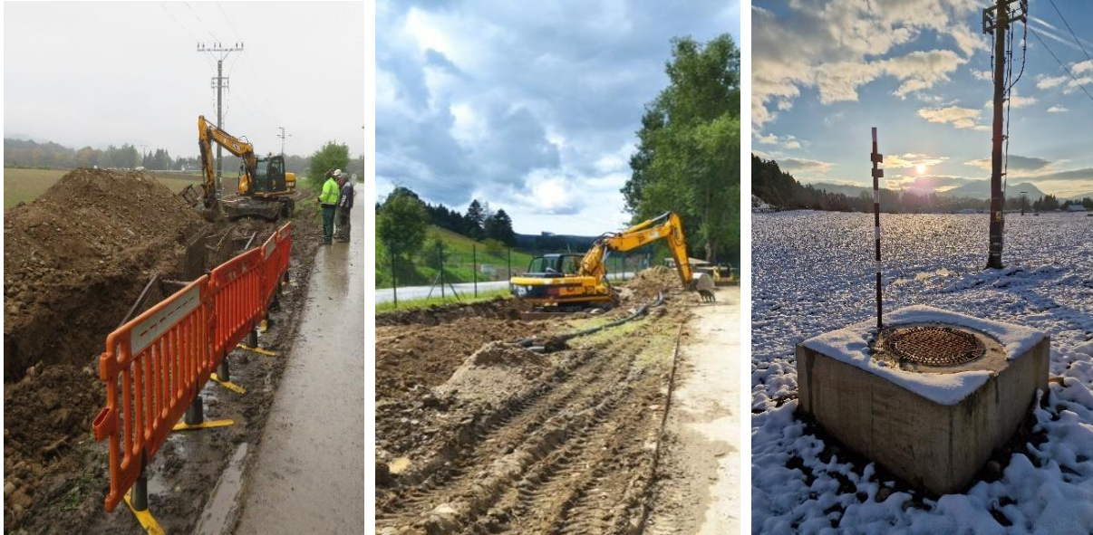
Obr. 8: Výstavba kanalizačného potrubia v k.ú Poruba-Gecel' (SS.07)

V sledovanom období bolo položených 166,87m kanalizačného potrubia. Celková dĺžka kanalizačného potrubia je 1690,37m (gravitácia a výtlač).