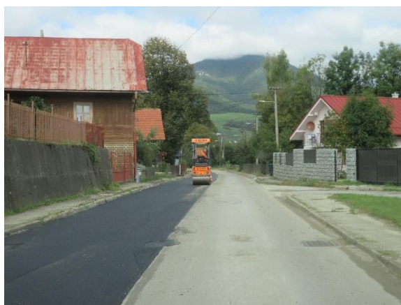
Obr. 2: Realizácia konečných úprav komunikácií v obci Žaškov (SS.01)

V sledovanom období boli zrealizované čerpacie stanice ČS.05 a ČS.06 – ukončená stavebná časť, osadená technológia, dispečing a prevedené komplexné skúšky.