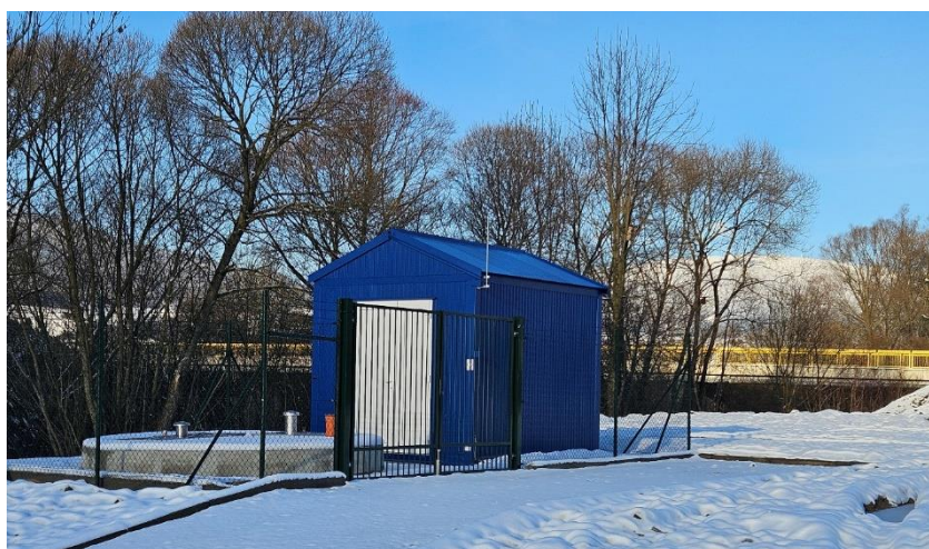
Obr. 7: Čerpacia stanica ČS04 a prevádzkový objekt v obci Žaškov (SS.05)

Práce na tomto stavebnom súbore boli zamerané najmä na výstavbu a sprevádzkovanie čerpacej stanice ČS04 – stavebná časť vrátane oplotení a úpravy terénu, výstavba prevádzkového objektu a osadenie, strojnotechnologickej časti, technológie a dispečingu.