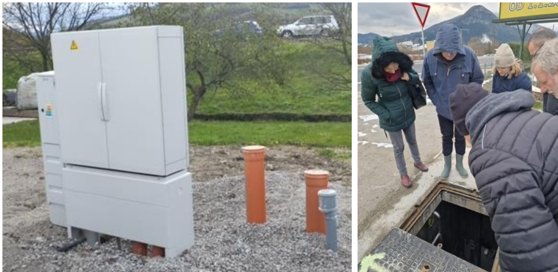
Obr. 6: ČS07 a ČS08 v obci Párnica (SS.01)

V sledovanom období boli zrealizované čerpace stanice ČS.07 a ČS.08 – ukončená stavebná časť, osadená technológia, dispečing a prevedené komplexné skúšky.