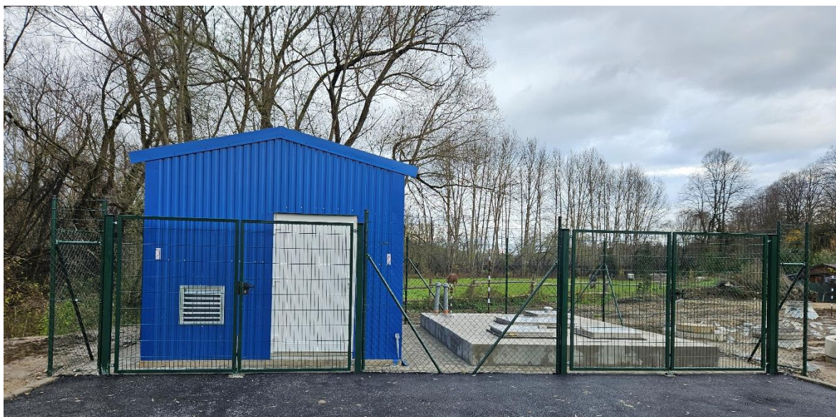
Obr. 9: Čerpacia stanica ČS02 a prevádzkový objekt v obci Oravská Poruba (SS.07)