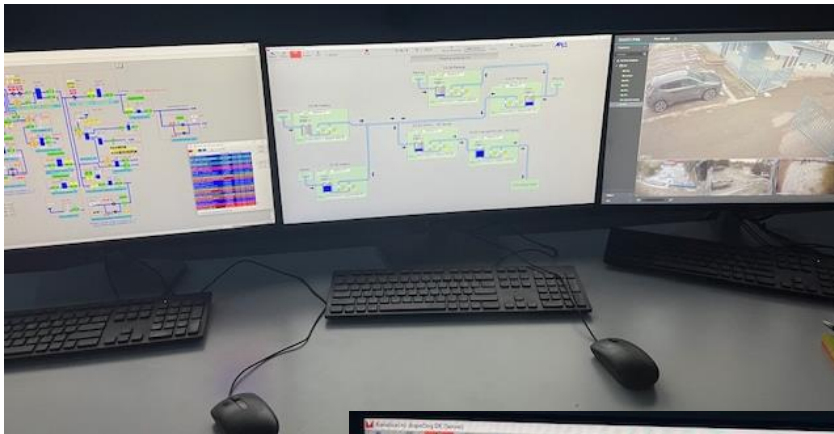
Obr. 11: Dispečing OVS, a.s.