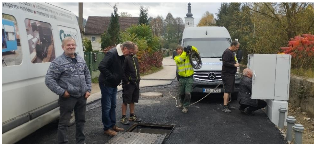
Obr. 3: ČS05 v obci Žaškov (SS.01)

V sledovanom období boli zrealizované čerpacie stanice ČS.05 a ČS.06 – ukončená stavebná časť, osadená technológia, dispečing a prevedené komplexné skúšky.