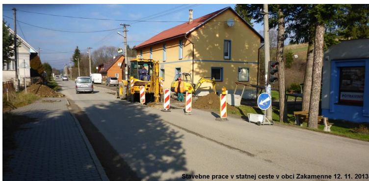
Stavebné práce v statnej ceste v obci Zakamenne 12. 11. 2013

OHL ŽS, a.s., Burešová 938/17, 660 02 Vevěří, Česká republika, OHL ŽS SK, a.s., Furmanská 6, 841 03 Bratislava, SR, MBM-GROUP, a.s., Hviezdoslavovo námestie 213, 029 01 Námestovo, SR